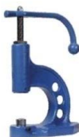
T105 Praska ręczna