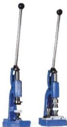
DKP 4125 Ręczny zestaw do cięcia i powlekania guzików