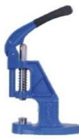
T101 Praska ręczna