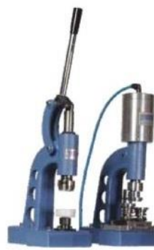
DKP 4127 Pneumatyczny zestaw do cięcia i powlekania guzików